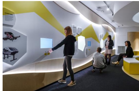
Un avenir électrique : Big-bang numérique