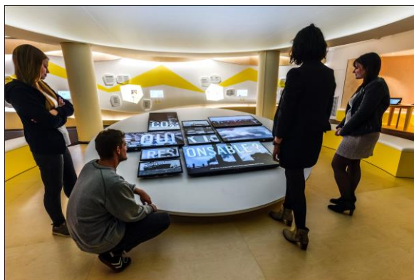
Nouvel espace Un avenir électrique

55 rue du Pâturage F - 68200 Mulhouse T 03 89 32 48 50 www.musee.electropolis