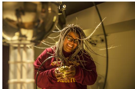
Animation au théâtre de l'électrostatique