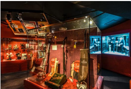
Les serveurs électriques