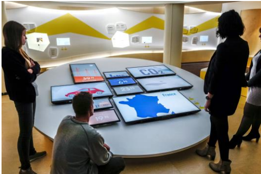
Un avenir électrique : Planète énergie