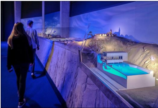
La grande maquette