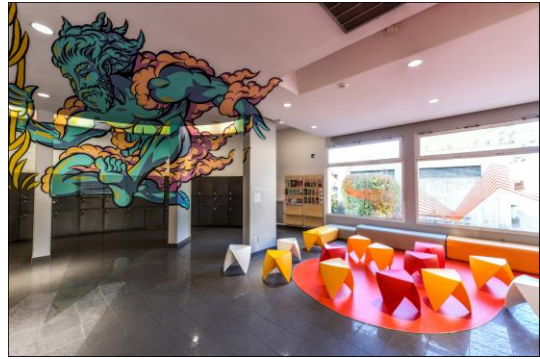
Anamorphose Zeus par Truly Design