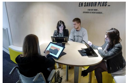
Un avenir électrique : Big bang numérique