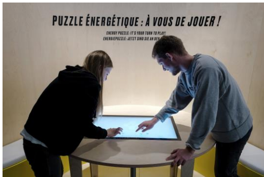
Un avenir électrique : Puzzle énergétique