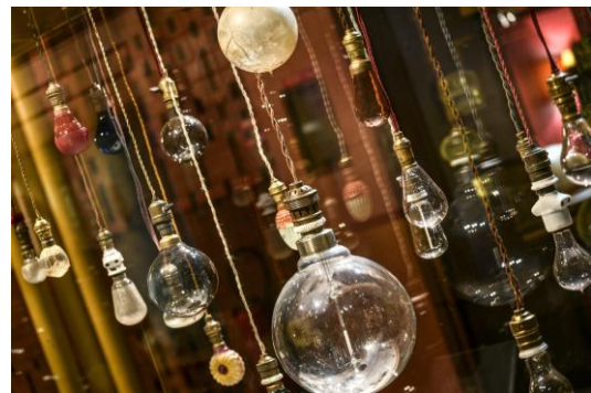
La lumière électrique.