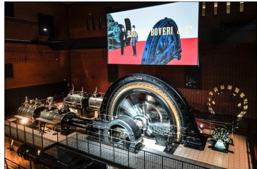
La machine Sulzer-BBC (1901)