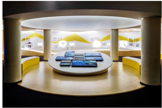
Un avenir électrique : Planète énergie