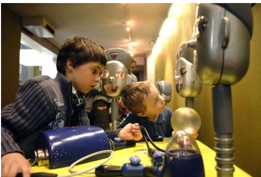
Qu'y a-t-il derrière la prise ?