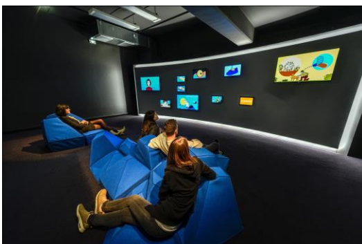
Un avenir électrique : Smart Sky