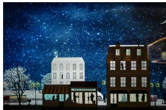
Un avenir électrique : théâtre d'images