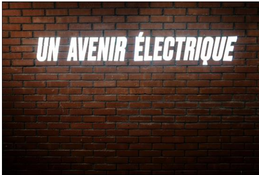
Un avenir électrique