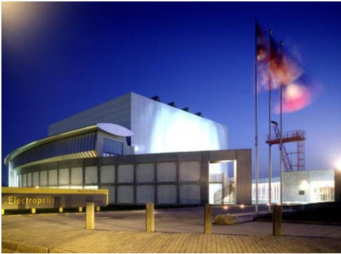
Musée Electropolis © Marc Barral-Baron