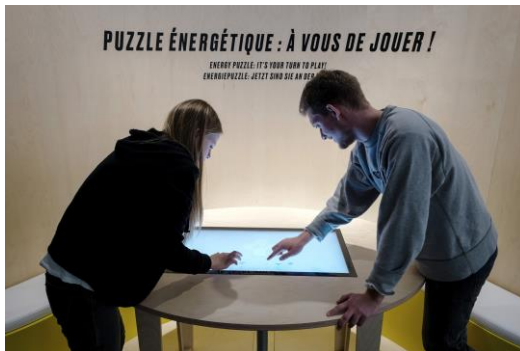
Un avenir électrique : Puzzle énergétique